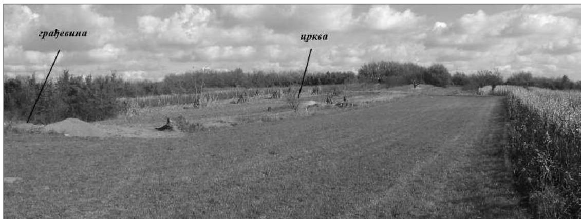
Figure 2 – Dupljaja-Grad, view from the Southwest towards the explored part of the site

Постојање налазишта из бронзаног доба у Граду потврђено је ситним уломцима грнчарије, нађеним изван затворених целина, док су трагови праисторијских насеља откривени у ареалу Подграђа, на потесу Риваче, непосредно уз обалу Караша. На потесу Виногради уочен је део зида грађеног каменом и римском опеком. Осим тога, на источном крају овог дела налазишта прикупљени су уломци грнчарије који могу да се одреде у XIV–XV столеће.