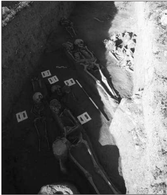
Слика 5 – Део некрополе у квадратима г. 22–23

новном правцу запад–исток. Тако окренути гробови нису нађени непосредно уз темеље већ у удаљенијим квадратима. Условно би могли да се припишу посебном хоризонту