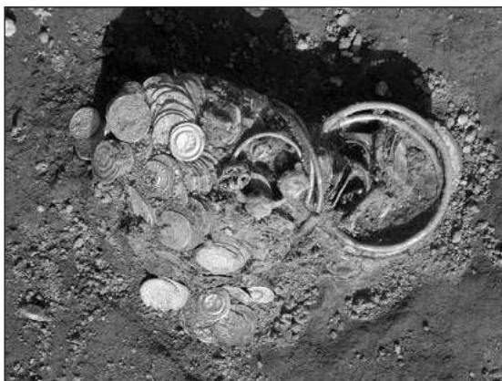
Figure 3 – Dupljaja-Grad, a hoard containing silver coins and jewelry

На источном рубу налазишта (потес Велики прокоп; сл. 1/1) постоји највероватније праисторијска хумка висока око 3 m, над којом је у средњем веку подигнута црква