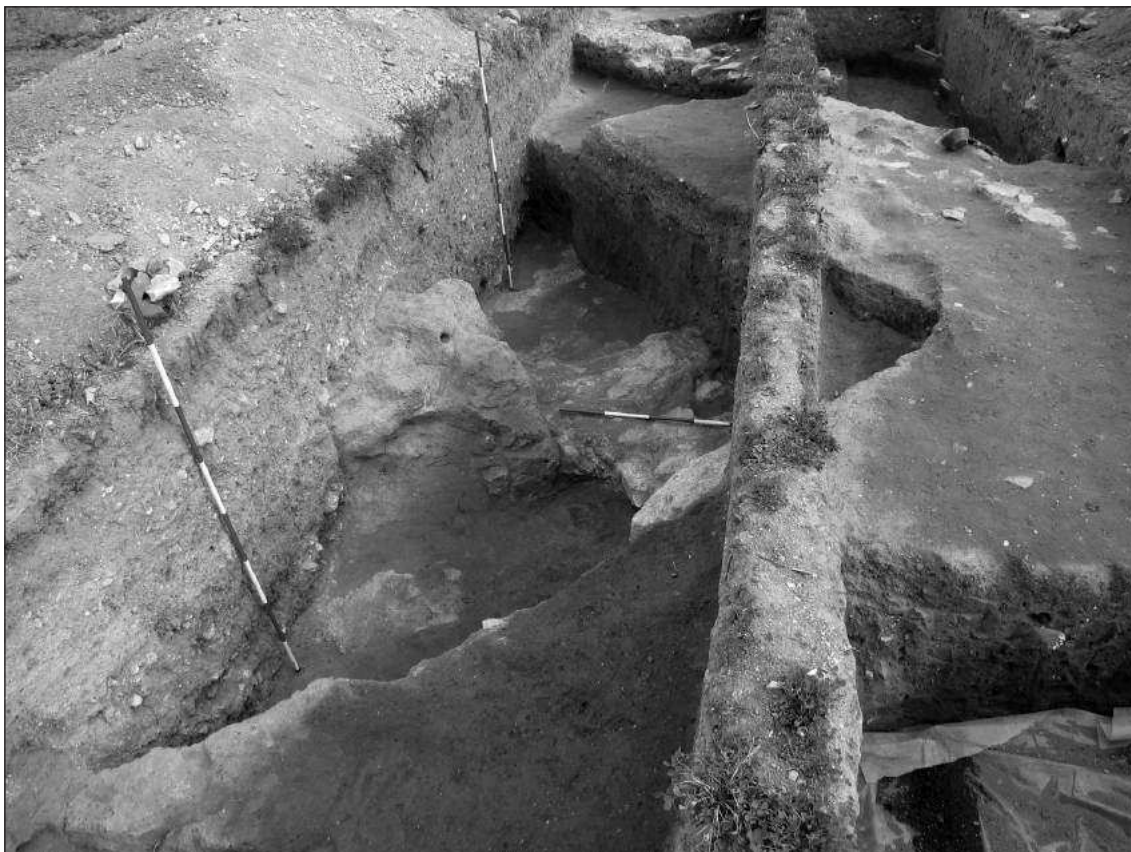
Слика 4 – Темелни ров југозападног угла цркве